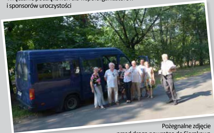
Pożegnalne zdjęcie przed drogą powrotną do Sierakowa