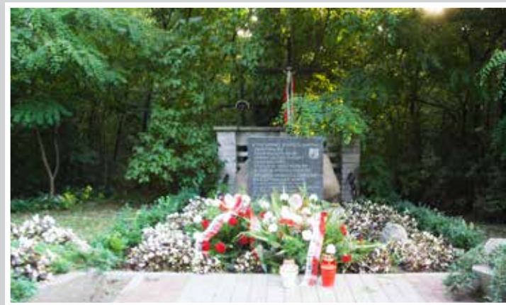
Pomnik w Lasku Pondra po uroczystościach