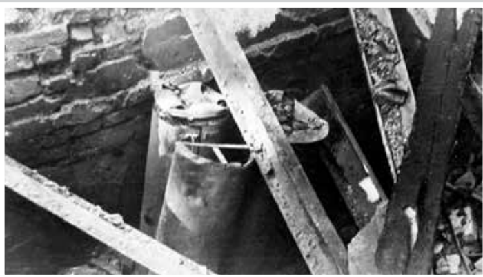
Pojemniki zrzutowe pozostałe w zniszczonym przez Niemców magazynie broni w „Lasku Pondra”, 10 sierpnia 1944 r.

Rezerwy Piechoty – Centrum Wyszkozenia Wojskowego Szarych Szeregów „Agrykola”, a później kursy podoficerskie w ramach powołanego Zastępczego Kursu Szkolenia Niższych Dowódców. Funkcjonowały tajne drukarnie i kolportaż prasy podziemnej, pracowały radiostacje nadawczo-odbiorcze, prowadzono nasłuchy radiowe.