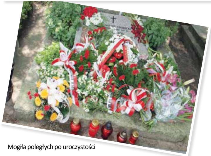
Mogiła poległych po uroczystości