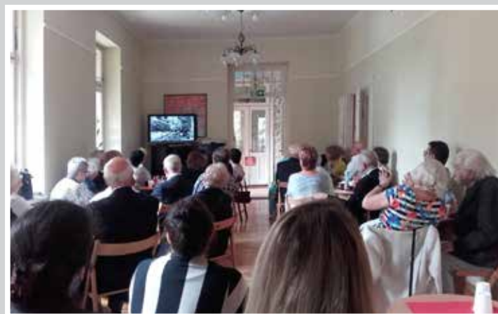
Projekcja filmu „Tragedia w Lasku Pondra” w willi „Księżanka” podczas spotkania uczestników uroczystości, 2016