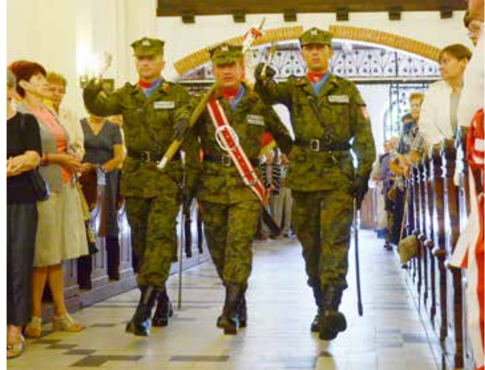
Poczet sztandarowy ŚZŻAK