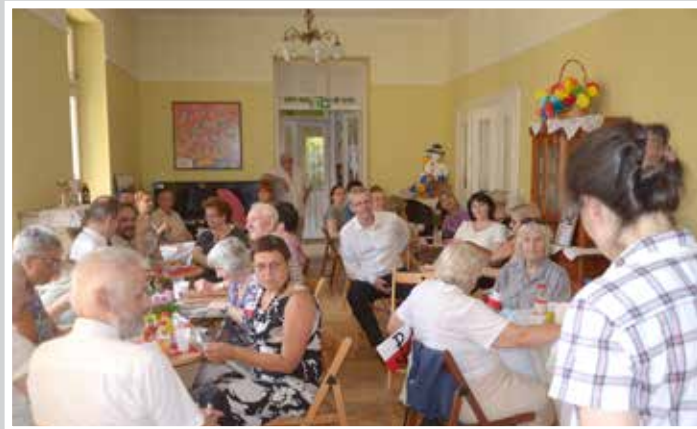
Wręczenie podziękowań dla współorganizatorów i sponsorów uroczystości