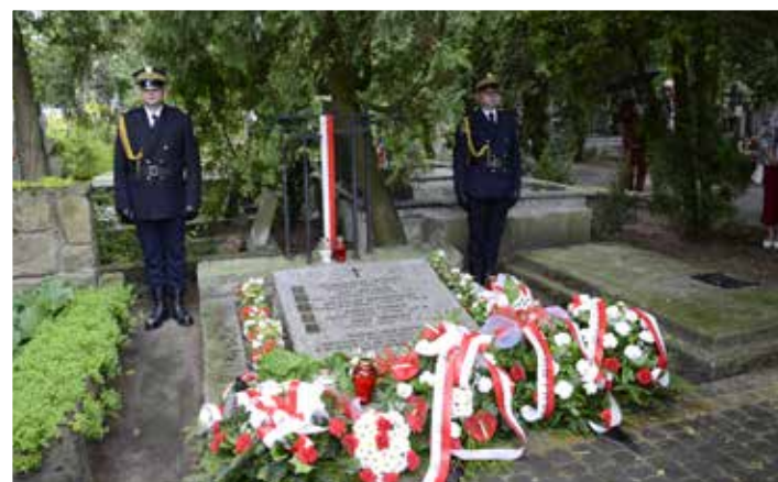
Warta honorowa przy grobie po uroczystości