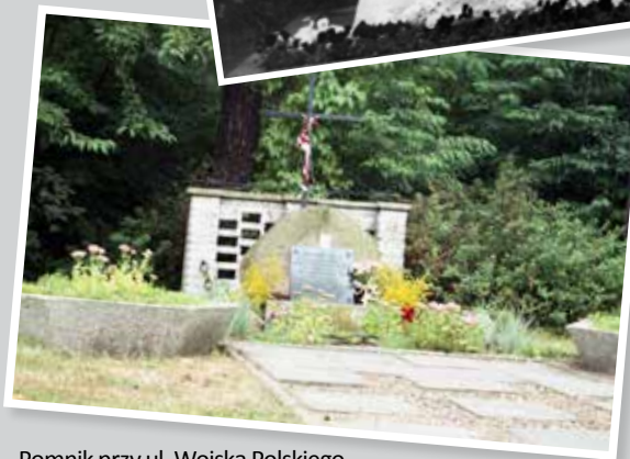
Pomnik przy ul. Wojska Polskiego z pierwszą wersją tablicy, 1996