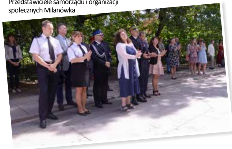
Przedstawiciele samorządu i organizacji społecznych Milanówka