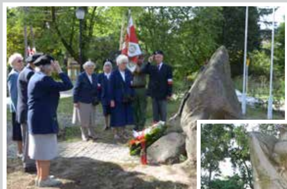
Hołd Żołnierz Środowiska „Mielizna” przed Pomnikiem Armii Krajowej na Skwerze Armii Krajowej w Milanówku, 1 sierpnia 2015

Uroczystość na Placu Stefana Starzyńskiego przy Pomniku Bohaterów w Milanówku w rocznicę wybuchu II wojny światowej, 1 września 2004