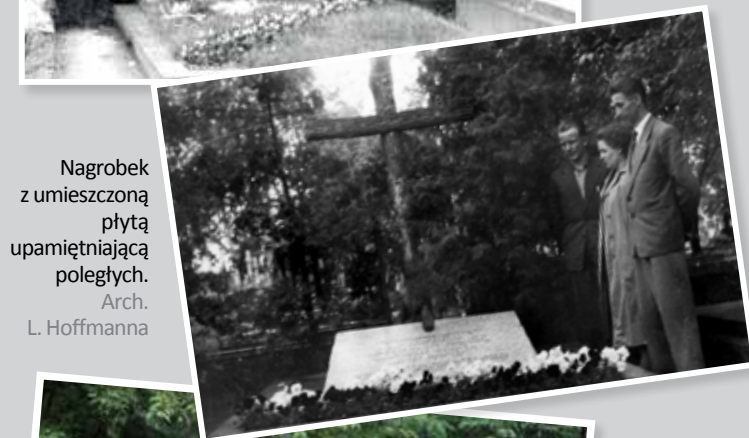
Nagrobek z umieszczoną płytą upamiętniającą poległych. Arch. L. Hoffmanna