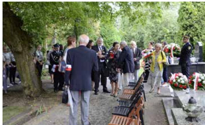
Przygotowania do uroczystości na cmentarzu