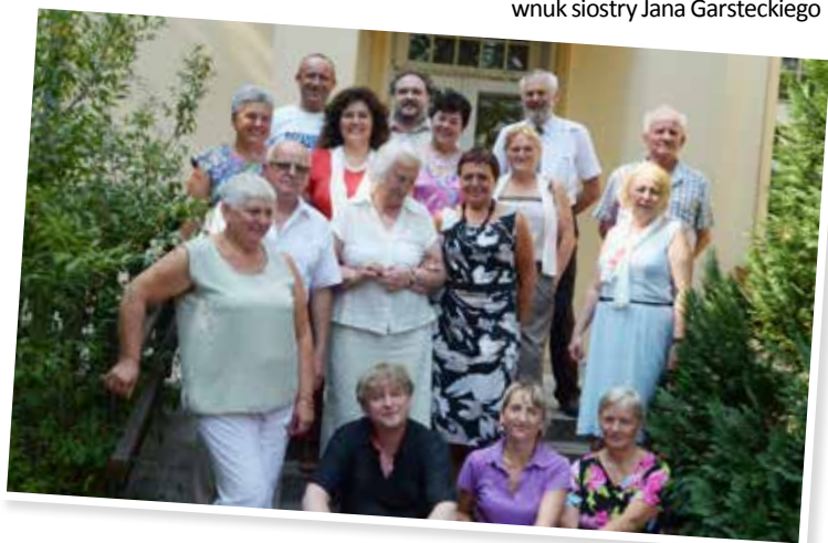
Na schodach willi „Księżanka” wraz z gośćmi z Sierakowa