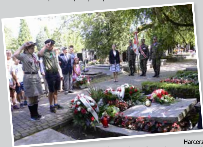
Harczerze podczas oddawania honorów po złożeniu kwiatów