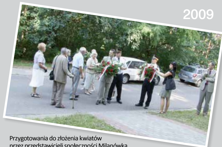
Przygotowania do złożenia kwiatów przez przedstawicieli społeczności Milanówka