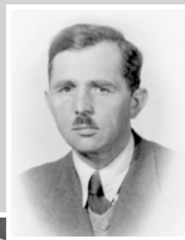
Kpt. Zygmunt Dąbrowski ps. „Bohdan”, z-ca dowódcy Obwodu „Bażant” AK