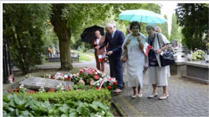
Tuż po uroczystości na cmentarzu