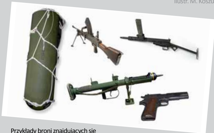
Przykłady broni znajdujących się w zrzutach alianckich