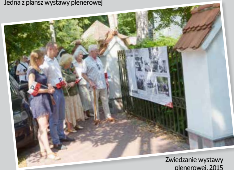
Zwiedzanie wystawy plenerowej, 2015