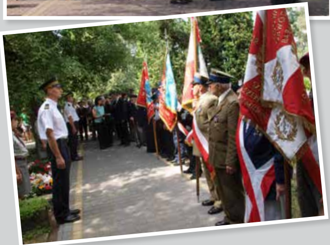
Poczty sztandarowe ŚZŻAK Śródownisko „Mielizna”, Związku Kombatantów RP i Byłych Więźniów Politycznych Koło Milanówek, OSP Milanówek i OSP MIFAM-Milanówek