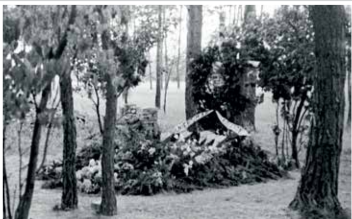
Tymczasowy grób w „Lasku Pondra”, sierpień 1945 r.