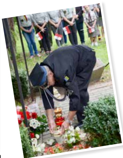
Znicz dla poległych od OSP Milanówek