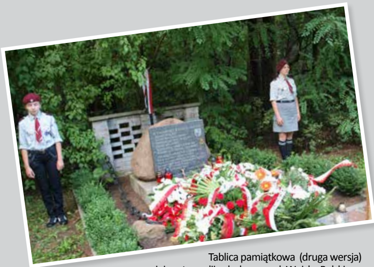
Tablica pamiątkowa (druga wersja) na miejscu tragedii w lasku przy ul. Wojska Polskiego