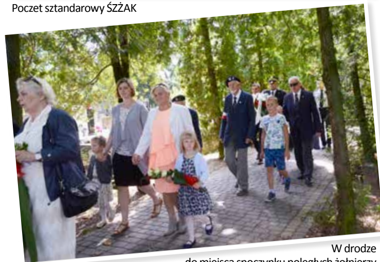
W drodze do miejsca spoczynku poległych żołnierzy