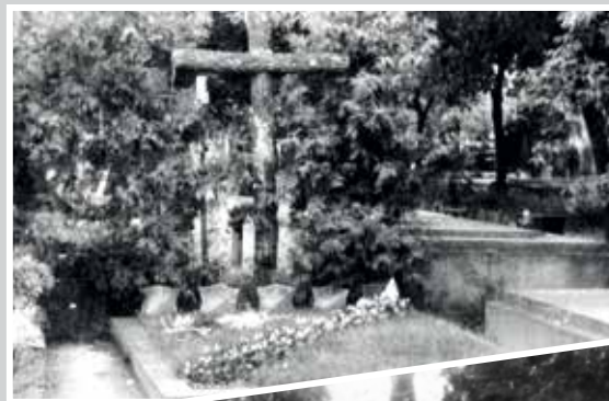
Wymurowany nagrobek w kw. XII cmentarza parafialnego.