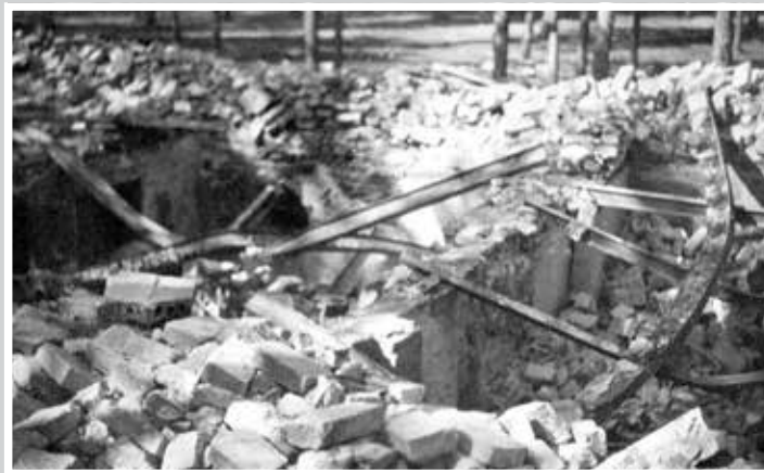
Ruiny magazynu broni Obwodu „Bażant”