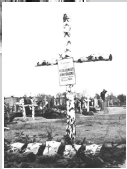
Pierwszy grób na cmentarzu parafialnym, 1945