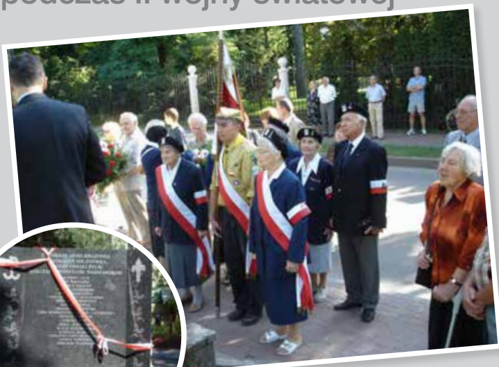
Odsłonięcie tablicy na Skwerze Armii Krajowej w Milanówku, upamiętniającej mieszkańców Milanówka, żołnierzy AK, którzy oddali życie w Powstaniu Warszawskim, 1 sierpnia 2009