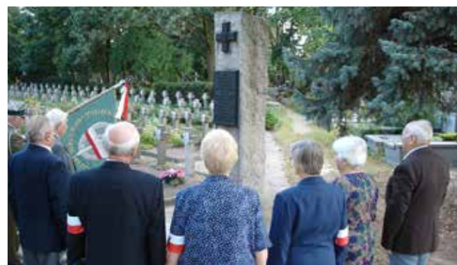
Oddanie hołdu uczestnikom Powstania Warszawskiego i ludności cywilnej Warszawy, zmarłym w wyniku ran i chorób w milanowskich szpitalach w okresie IX 1944-VII 1945, 1 września 2004