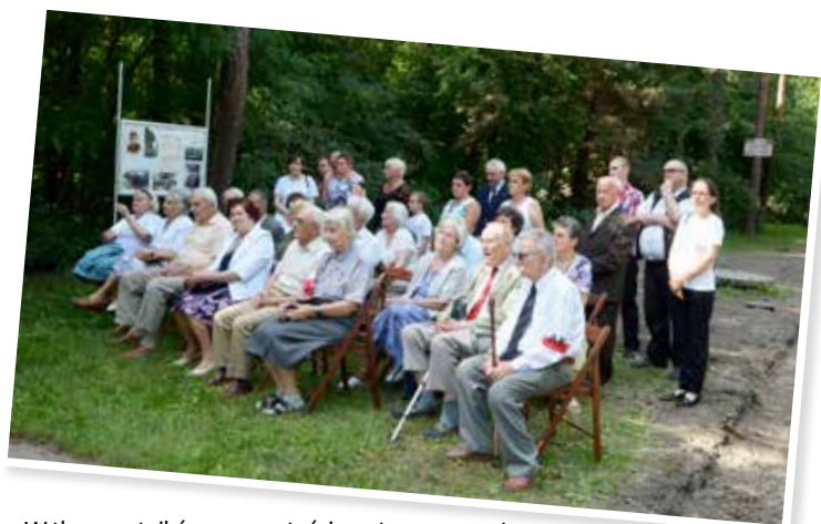
W tle uczestników uroczystości wystawa przygotowana przez Archiwum Dokumentacji Osobowej i Płacowej w Milanówku