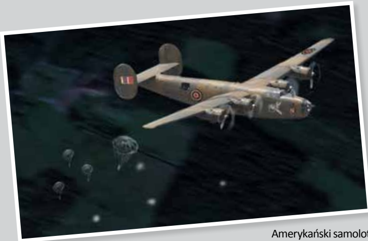
Amerykański samolot B-24 Liberator dokonujący zrzutów nad „Solnicą” Ilustr. M. Koszuta