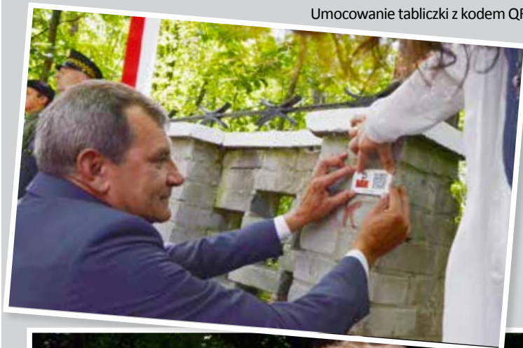
Umocowanie tabliczki z kodem QR