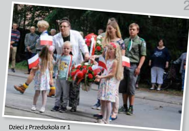
Dzieci z Przedszkola nr 1 „Pod dębowym listkiem” przed złożeniem kwiatów

Hołd poległym składają milanowscy harcerze