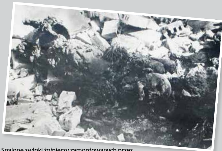
Spalone zwłoki żołnierzy zamordowanych przez Niemców – dowód zbrodni hitlerowskiej