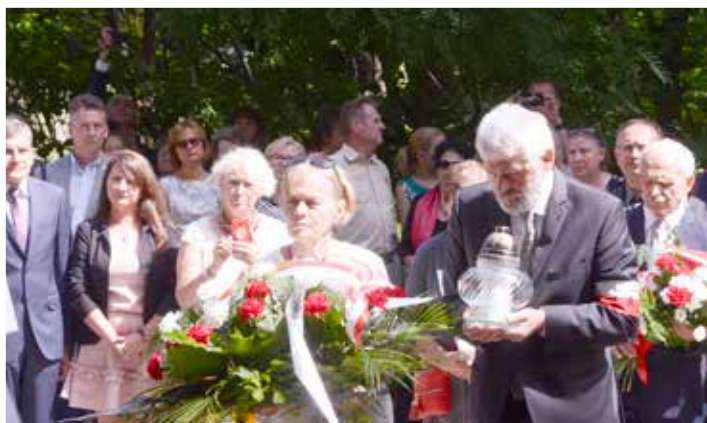
Przedstawiciele społeczności Sierakowa