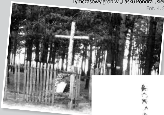
Symboliczny grób wykonany na miejscu kaźni w lasku przy ul. Wojska Polskiego, po ekshumacji zwłok