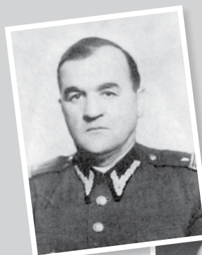
Kpt./mjr Alojzy Mizera ps. „Siwy”, dowódca Obwodu „Bażant” AK