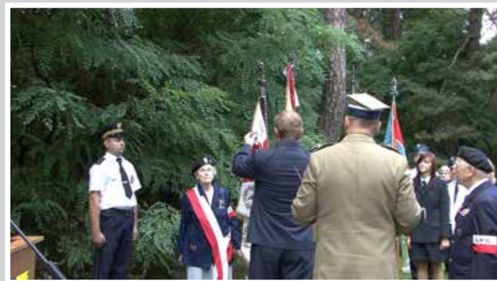
Odnaczenie sztandaru ŚZZAK Środowisko „Mielizna”