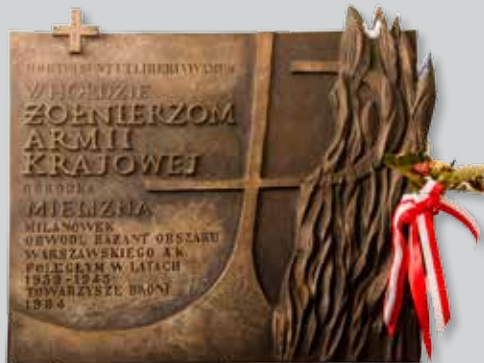
Tablica z kruchty kościoła pw. św. Jadwigi Śląskiej upamiętniająca wszystkich żołnierzy Ośrodka „Mielizna” Milanówek Obwodu „Bażant” Obszaru Warszawskiego AK poległych w latach 1939-1945