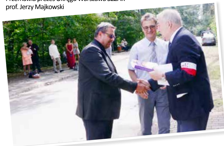
Wręczenie dla przedstawicieli władz Powiatu Grodzkiego publikacji o miejscach pamięci AK w Warszawie i okolicach