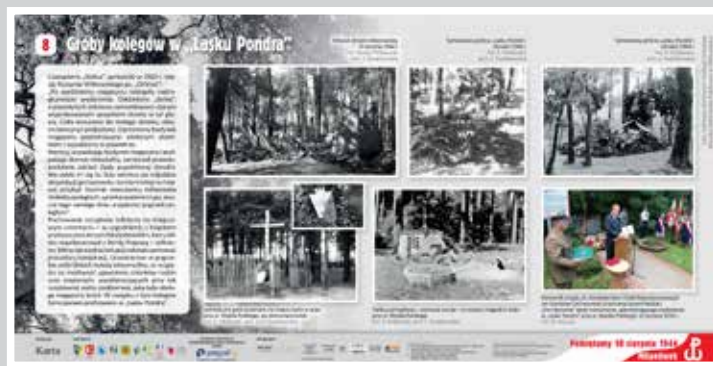
Jedna z plansz wystawy plenerowej